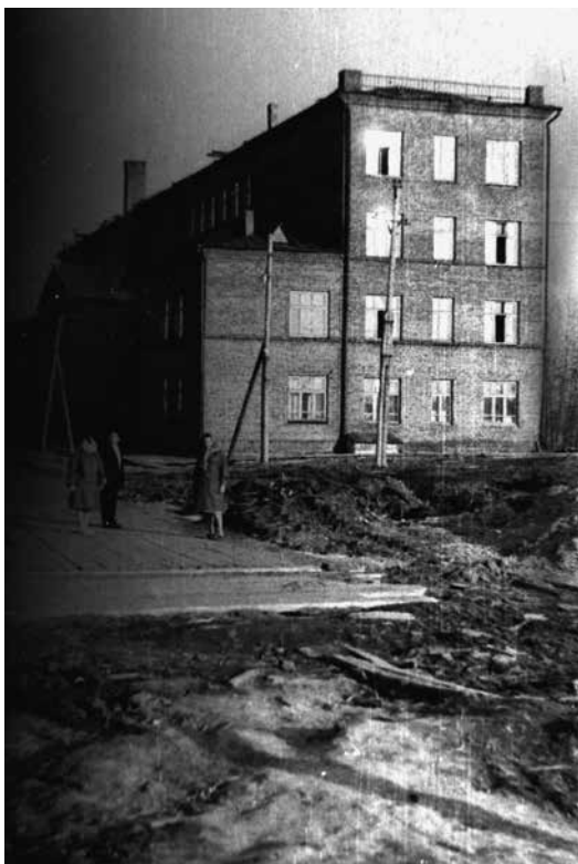
Архангельская школа № 95 – госпиталь в 1941–1944 гг.

Важно отметить, что с первых дней войны Архангельск являлся госпитальной базой Карельского фронта. Эвакуацию раненых и больных, нуждавшихся в более длительном лечении, осуществляли круглогодично железнодорожным транспортом по ветке Сорокская – Обозерская на магистраль Архангельск – Вологда, а во время летней навигации – морскими санитарно-транспортными судами через порты Кандалакша, Кемь и Беломорск. До конца навигации 1941 г. в период ожесточенных боев первого периода обороны Заполярья морскими транспортом из госпиталей Кандалакши в Архангельск были доставлены 19000 человек. Вспомогательную роль в эвакуации играли воздушный и автомобильный транспорт.