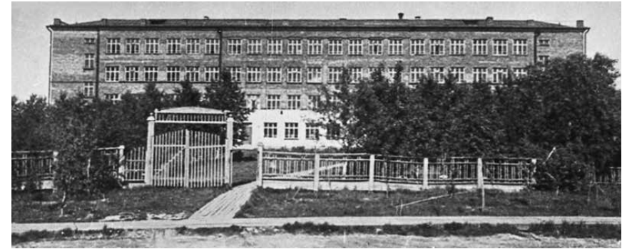
Школа № 95. Архангельск, конец 1930-х – начало 1940 гг.

В мае 1940 г. состоялся первый выпуск десятиклассников. А уже в 1941 г. началась Великая Отечественная война, и здание школы начали оборудовать под эвакуогоспиталь. У выпускников 1941 г. не было выпускного бала, они даже не успели все вместе сфотографироваться.