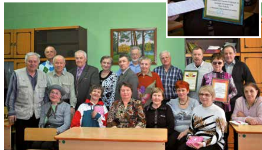
Шашечный турнир в клубе «Ферзь и шашечка», организованном Советом ветеранов Ломоносовского округа. Архангельск, 2017 г.