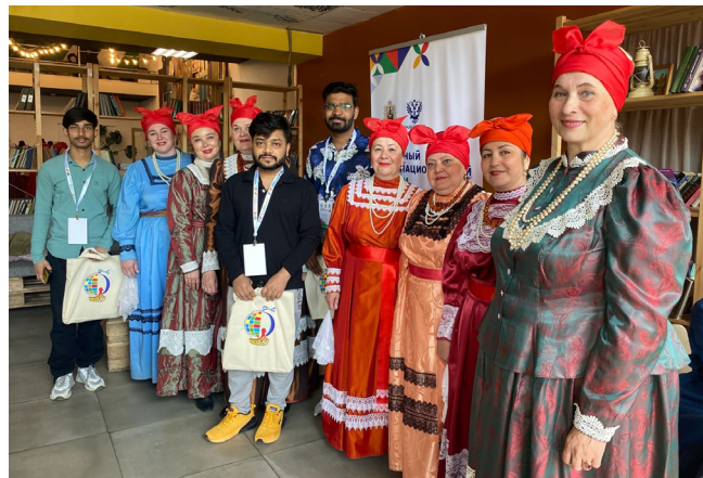
→ Студенты МФВОП СГМУ с участниками форума

комились с участниками ансамбля «Казачья вольница» из Северодвинска и сожалели, что не могут поехать к ним в связи с новыми ограничениями в области миграционного законодательства.