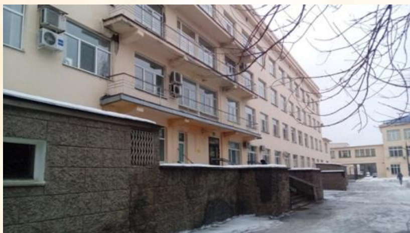
4-х этажное здание, вход со двора