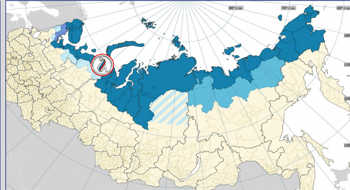
Северный государственный медицинский университет на карте Арктической зоны Российской Федерации