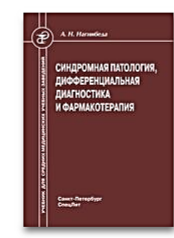
Синдромная патология, дифференциальная диагностика и фармакотерапия