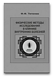
Физические методы исследования в клинике внутренних болезней