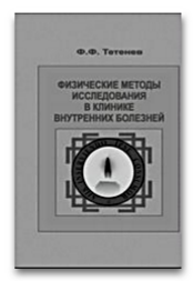
Физические методы исследования в клинике внутренних болезней