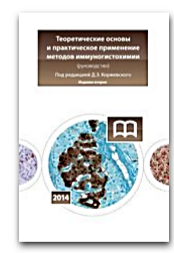
Теоретические основы и практическое применение методов иммуногистохимии