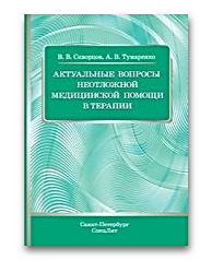
Актуальные вопросы неотложной медицинской помощи в терапии

- Теперь Вы прикреплены к институту и имеете доступ к подпискам института и к полному функционалу своего личного кабинета.