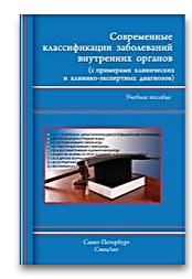
Современные классификации заболеваний внутренних органов