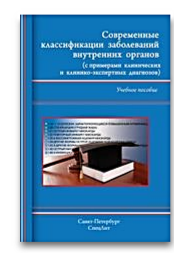
Современные классификации заболеваний внутренних органов