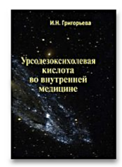
Урсодезоксихолевая кислота во внутренней медицине