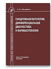
Синдромная патология, дифференциальная диагностика и фармакотерапия