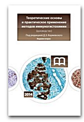
Теоретические основы и практическое применение методов иммуногистохимии