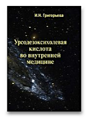
Урсодезоксихолевая кислота во внутренней медицине