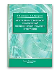
Актуальные вопросы неотложной медицинской помощи в терапии

- Вы имеете доступ к подписке института и к полному функционалу своего личного кабинета из дома или другого места.