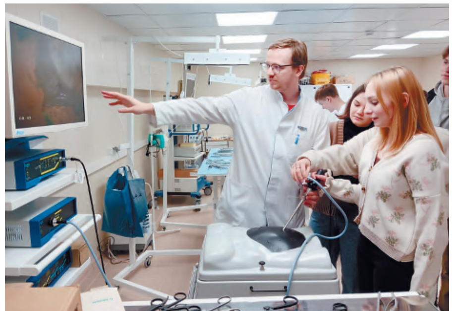
В рамках профориентационной работы проводятся экскурсии для старшеклассников