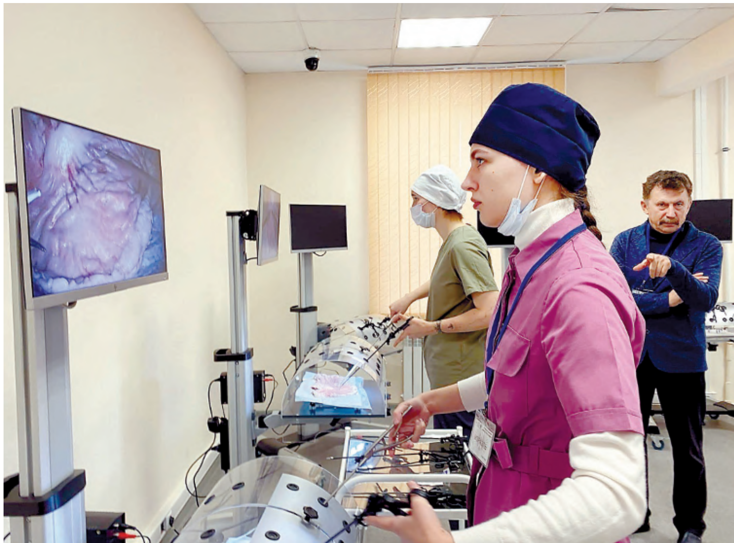
В студенческой операционной