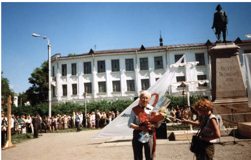
Почетный гражданин г. Архангельска, 1997 г.