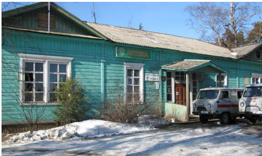
Шенкурская районная больница