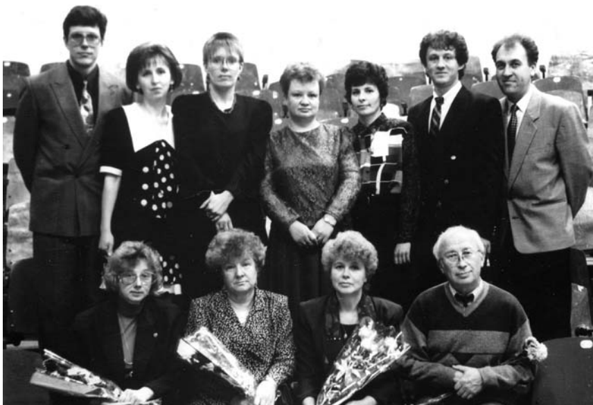
Встреча с выпускниками – 7 группа, четвертый выпуск педиатров АГМИ (1986 г.), Архангельск, 1991 г.