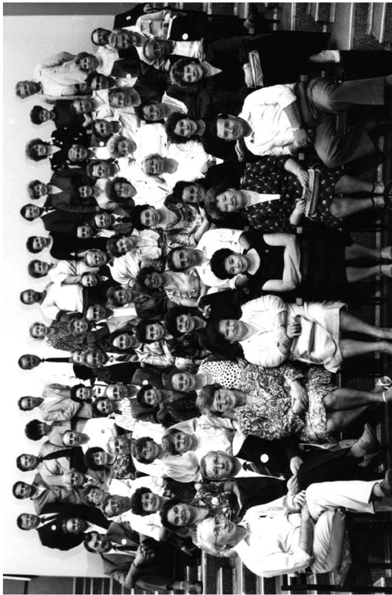
Встреча выпускников АГМИ 1964 г., посвященная 20-летию окончания института, 1984 г.