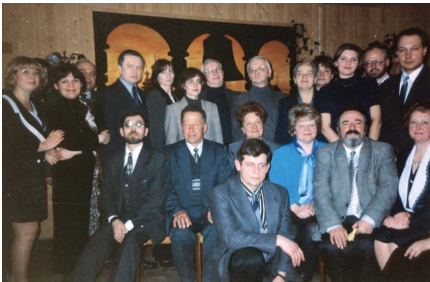
Встреча с выпускниками педиатрического факультета АГМИ, 1996 г.