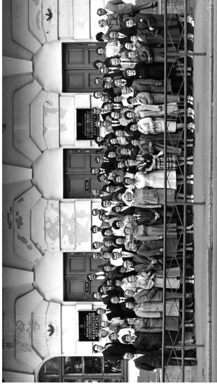
Встреча с однокурсниками, посвященная 30-летию окончания АГМИ, 1994 г.