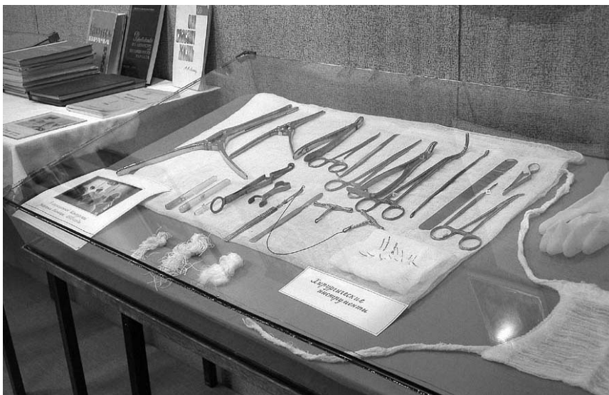
Фрагмент экспозиции Шенкурского краеведческого музея, 2010 г.