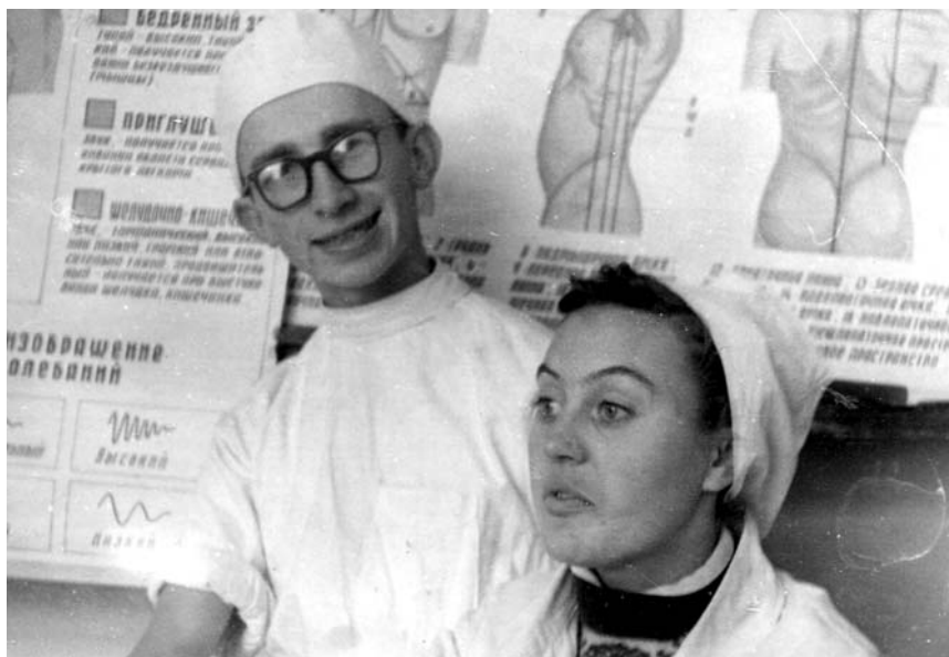
На кафедре физиологии АГМИ, 2 курс, 1960 г.