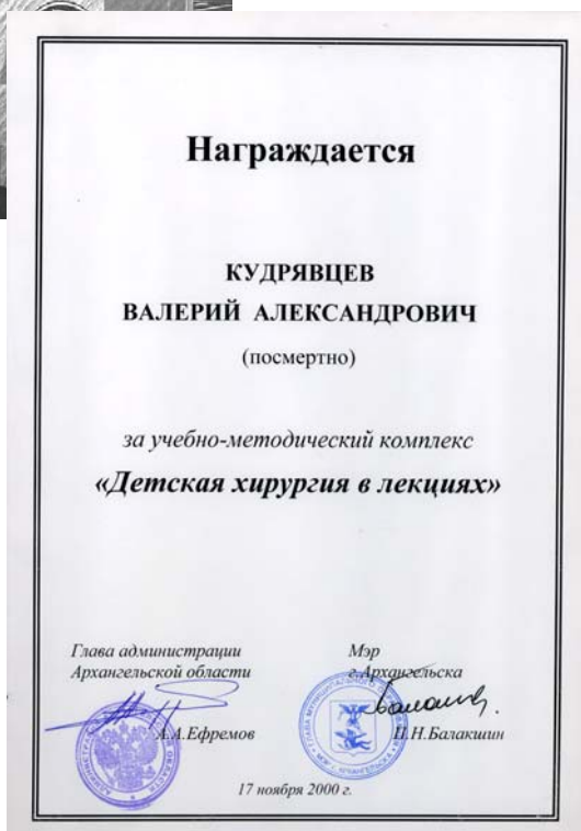
Диплом лауреата Ломоносовской премии (посмертно), 2000 г.