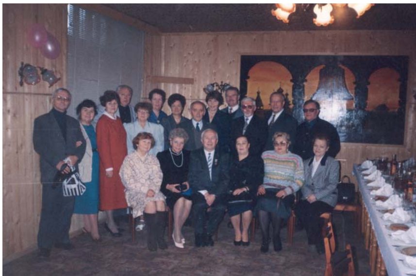
Последняя встреча с однокурсниками в АГМА, 1999 г.