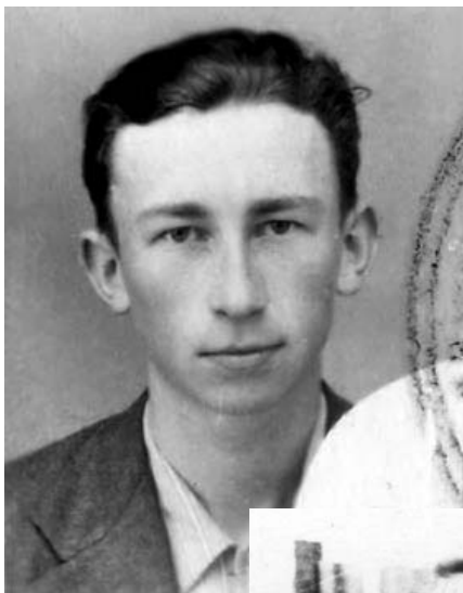
Выпускник Шенкурской школы, 1958 г.