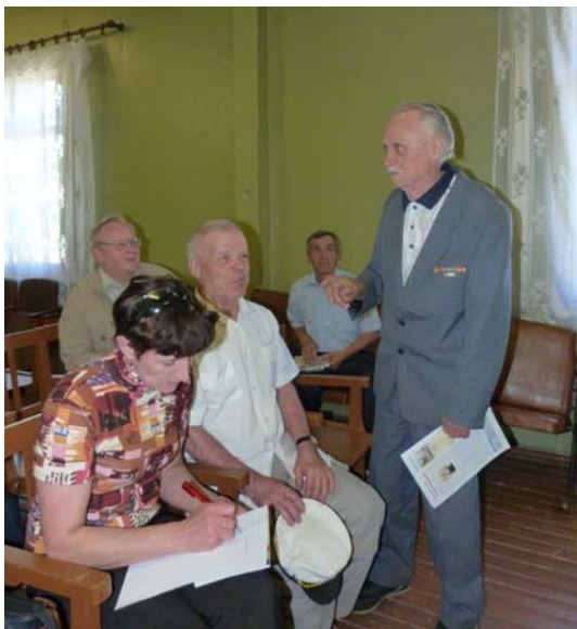
Заседание рабочей группы по созданию книги, посвященной В.А. Кудрявцеву. Шенкурск, 2013 г.