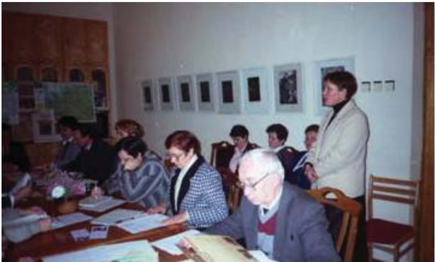
В Ломоносовском фонде, г. Архангельск, 1990-е гг.