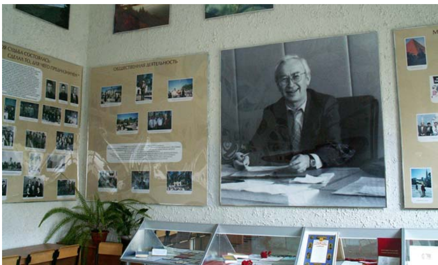
Аудитория имени В.А. Кудрявцева в СГМУ, 2006 г.