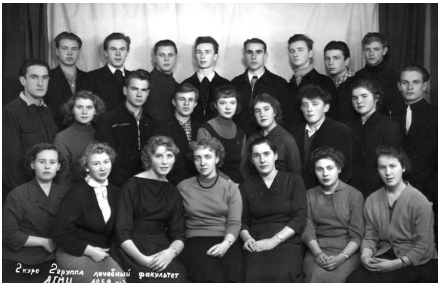
2-й курс, лечебный факультет АГМИ, 2 группа, Архангельск, 1959 г.