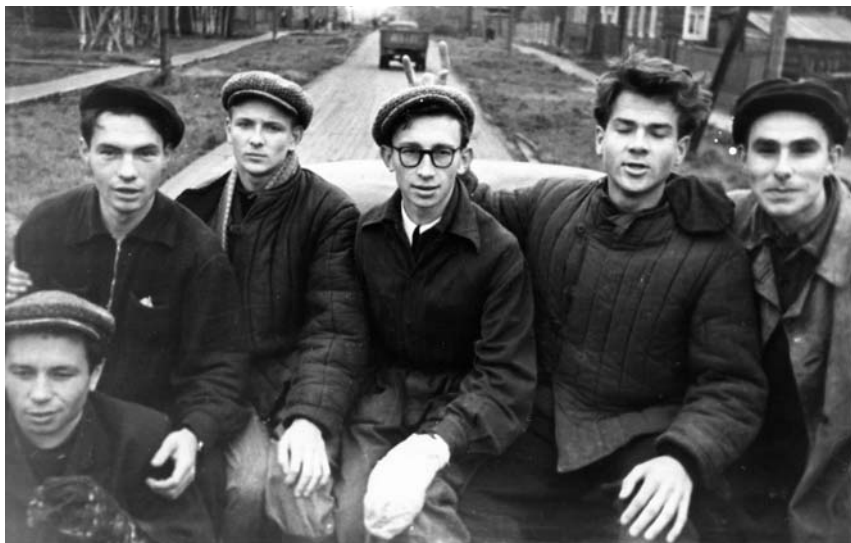
На первом курсе АГМИ, весна, 1959 г.