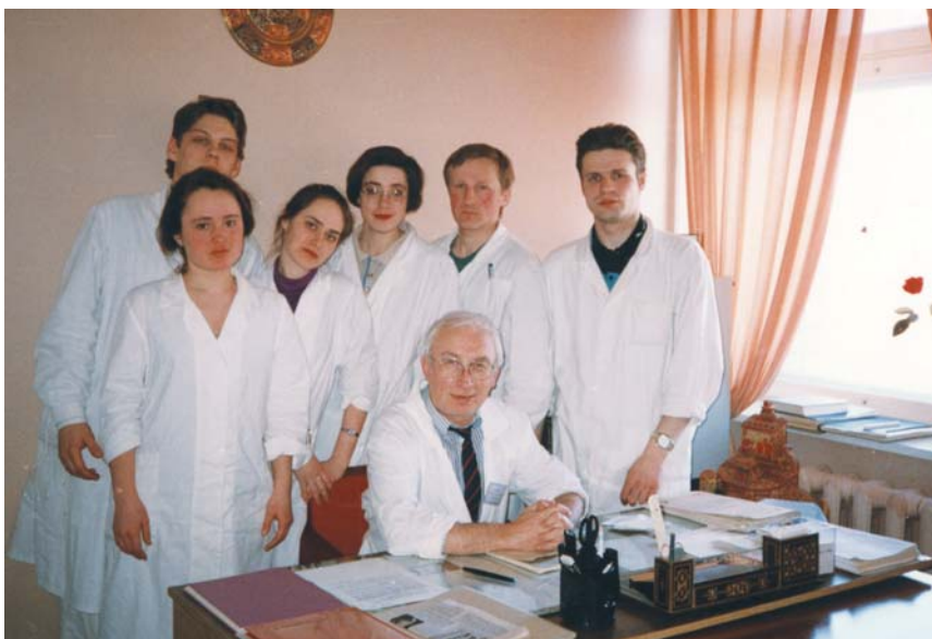
С субординаторами АГМИ 14 выпуска, 1996 г.