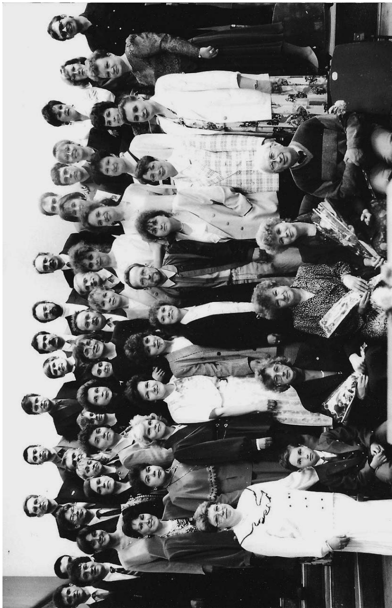
На встрече с выпускниками педиатрического факультета АГМИ 1986 г., Архангельск, 1991 г.