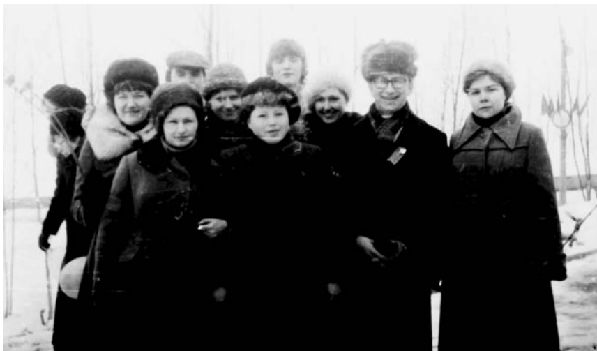
Со студентами АГМИ на демонстрации, 7 ноября 1981 г.