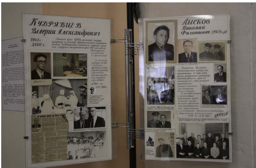
Экспозиция памяти В.А. Кудряцева в краеведческом музее, Шенкурск, 2010 г.