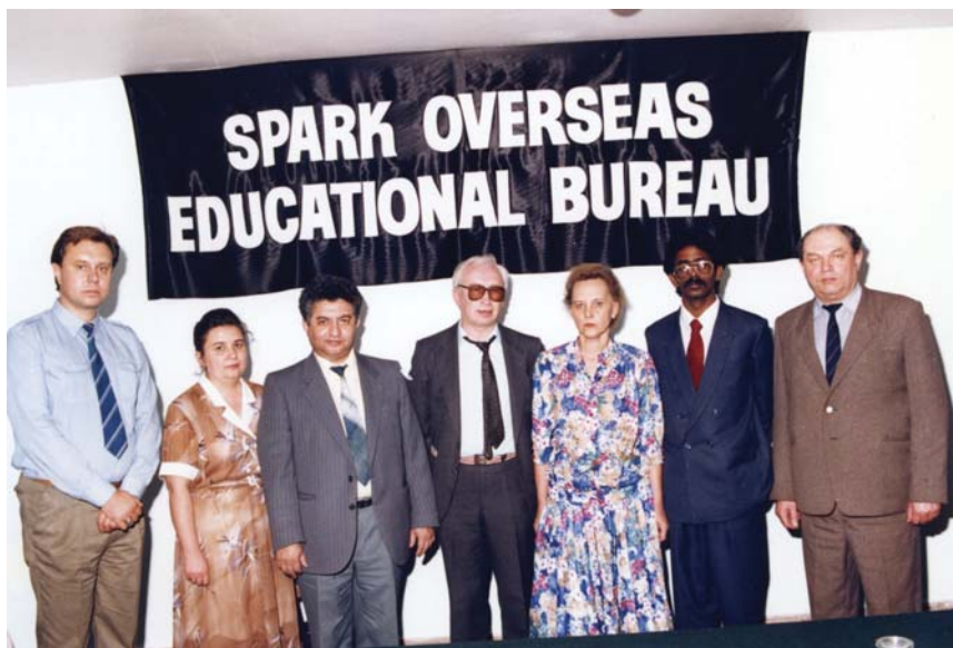
Во время поездки в Индию, январь, 1992 г.