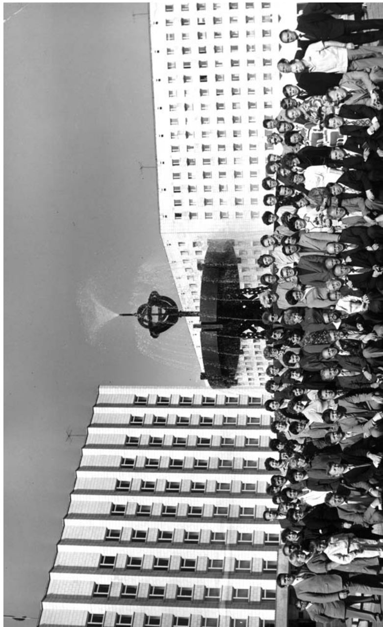
Встреча выпускников, посвященная 25-летию окончания АГМИ, 1989 г.