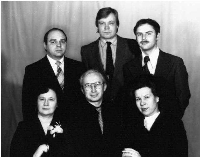
Коллектив кафедры детской хирургии АГМИ, 1980-е гг.