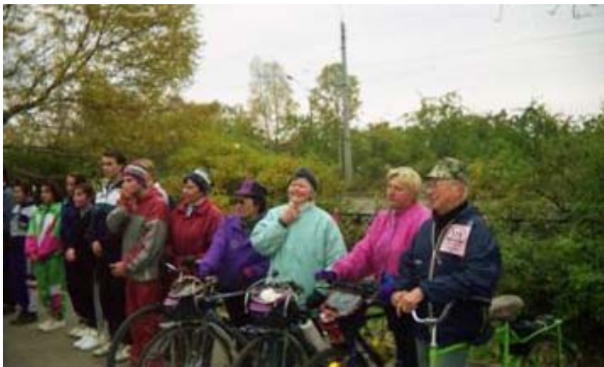
Участники велопробега Архангельск–Холмогоры, 1990-е гг.