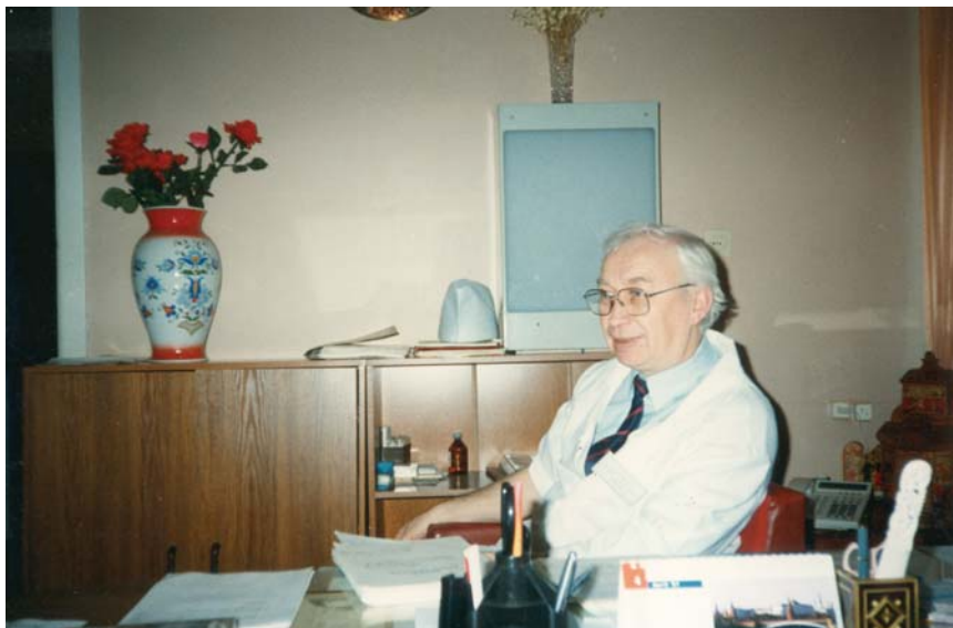
На кафедре детской хирургии АГМА