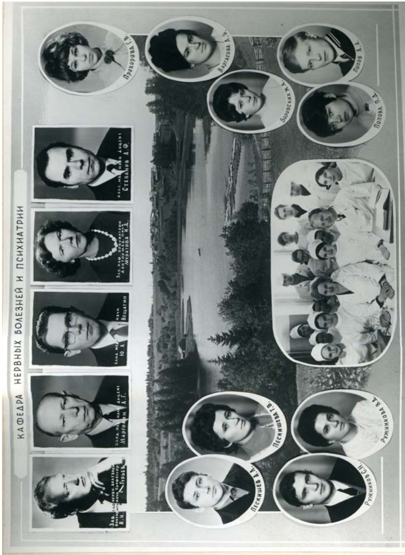
37-й выпуск лечебного факультета АГМИ. 1972 г.