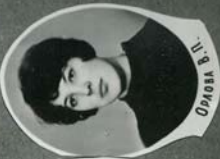
34-й выпуск лечебного факультета АГМИ. 1969 г.