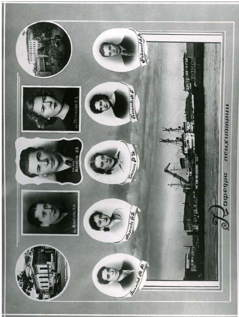
25-й выпуск лечебного факультета АГМИ. 1960 г.