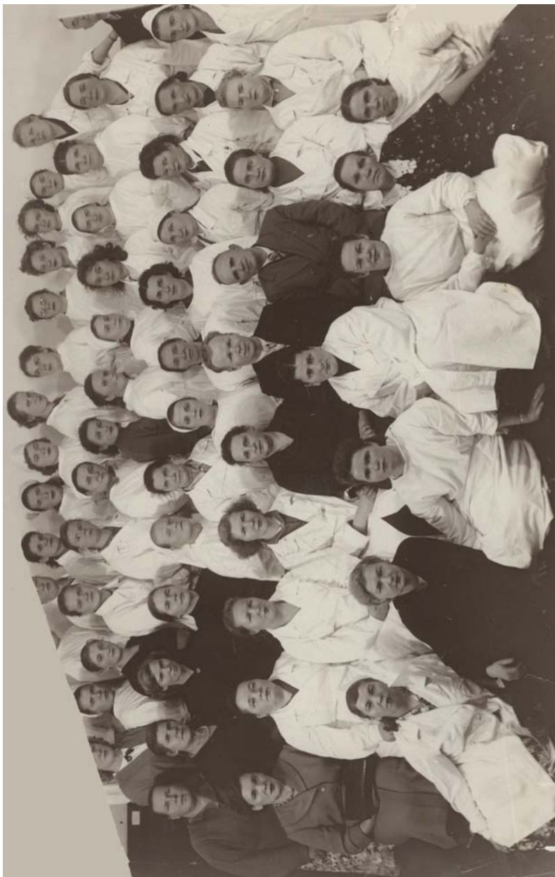
Коллектив Архангельской областной психиатрической больницы. Конец 1950-х гг.