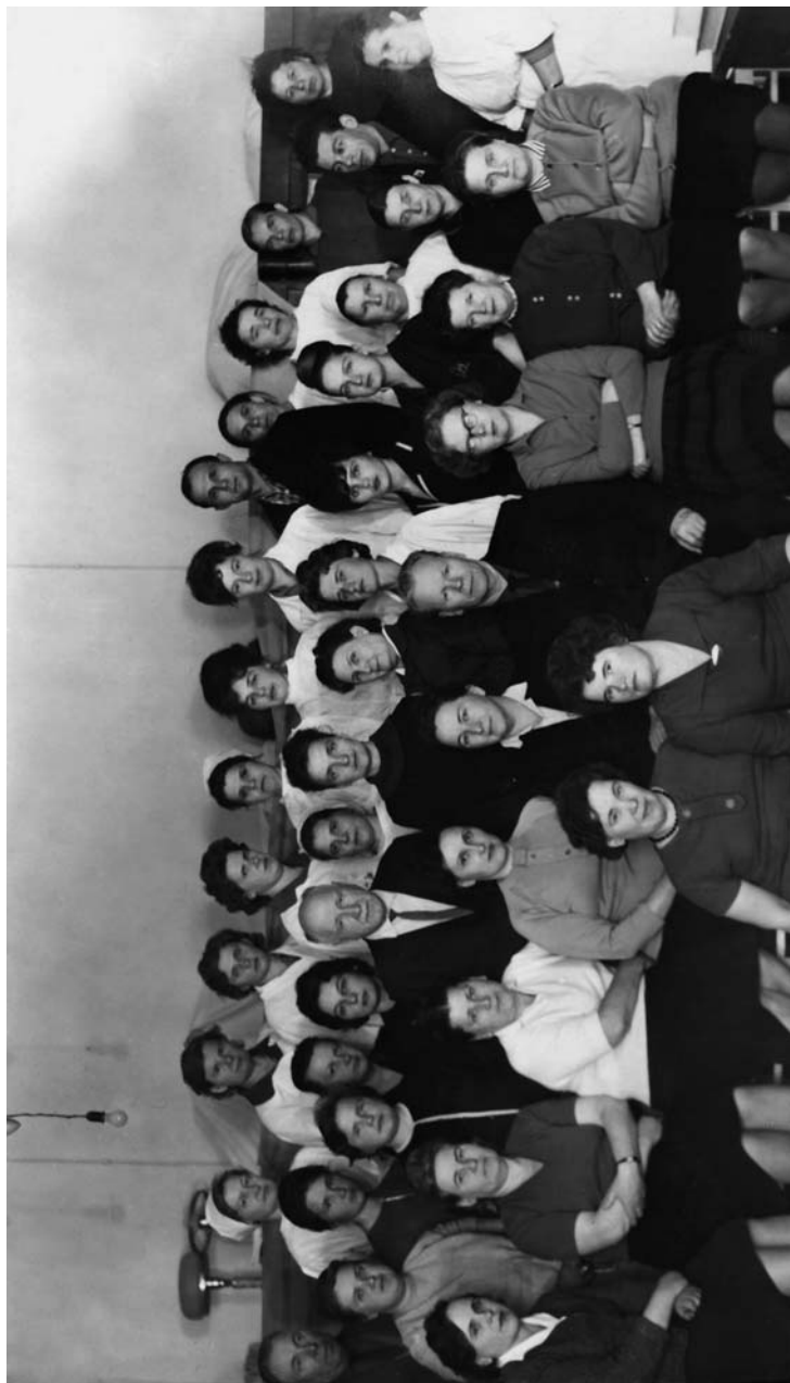
Коллектив врачей Архангельской психиатрической больницы и ПНД с сотрудниками кафедры психиатрии АГМИ. 1965 г.