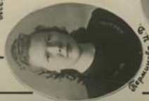
Проф. Владимир Павлович Бармин