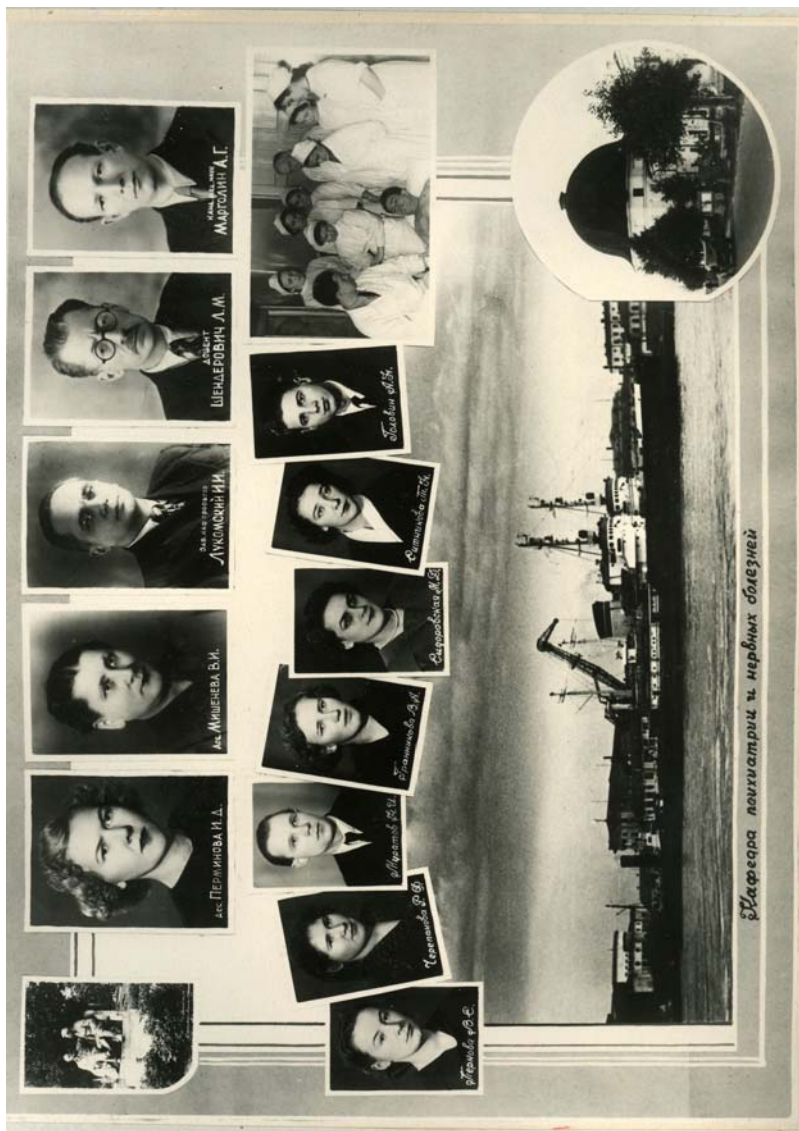
Шкофера психиатрич и нервних болезней

22-й выпуск лечебного факультета АГМИ. 1957 г.