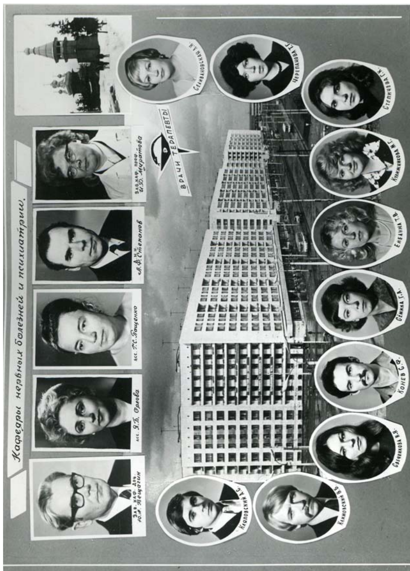
43-й выпуск лечебного факультета АГМИ. 1978 г.