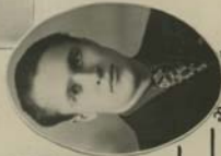
Проф. Александр Семенович Железковский