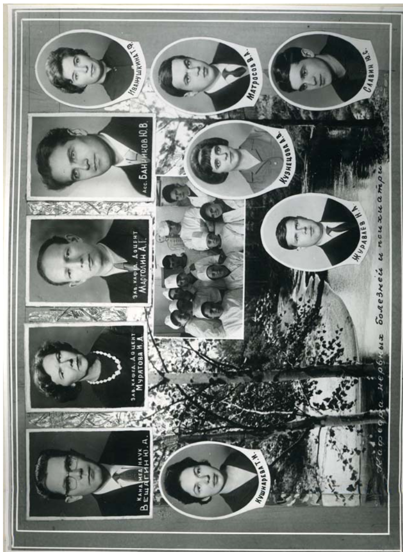
33-й выпуск лечебного факультета АГМИ. 1968 г.