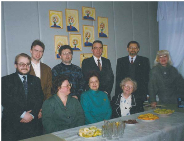
Сотрудники кафедры психиатрии. 13.03.1996 г.