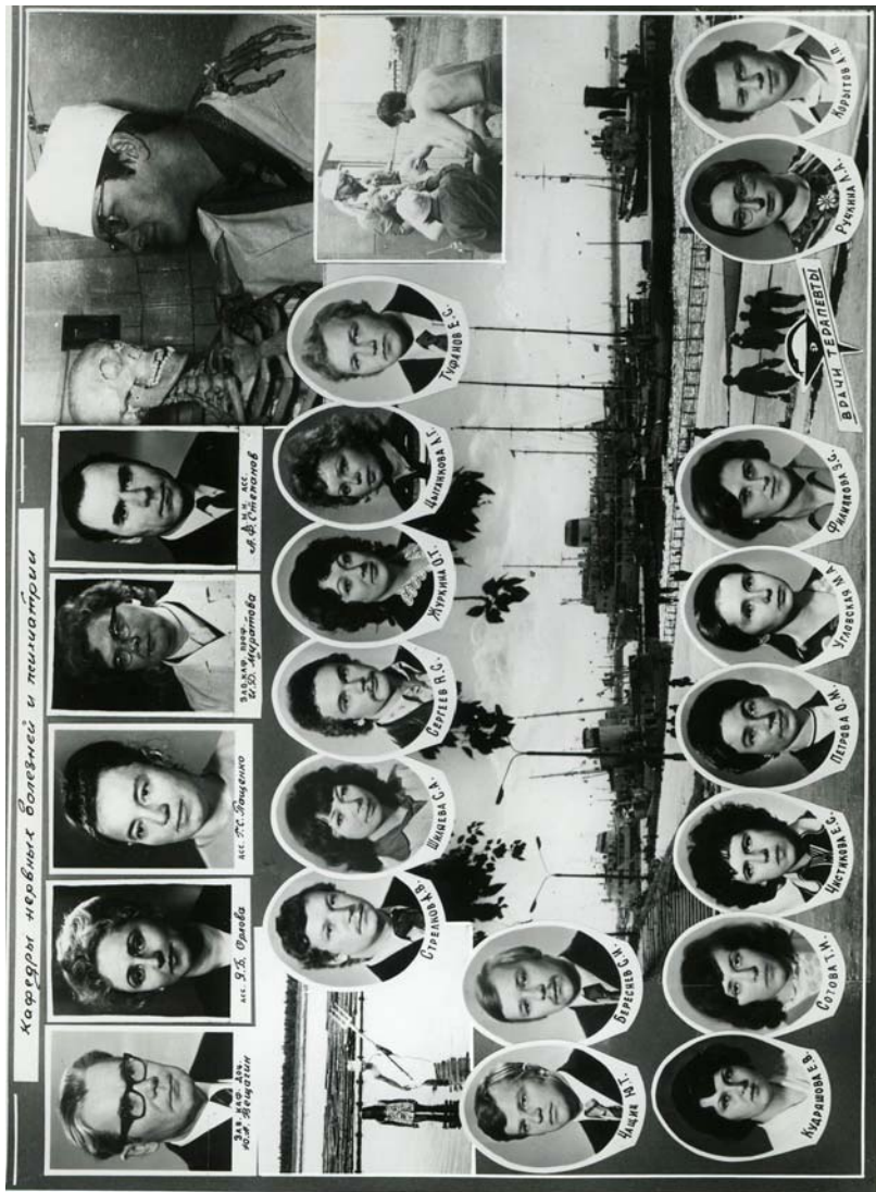
42-й выпуск лечебного факультета АГМИ. 1977 г.