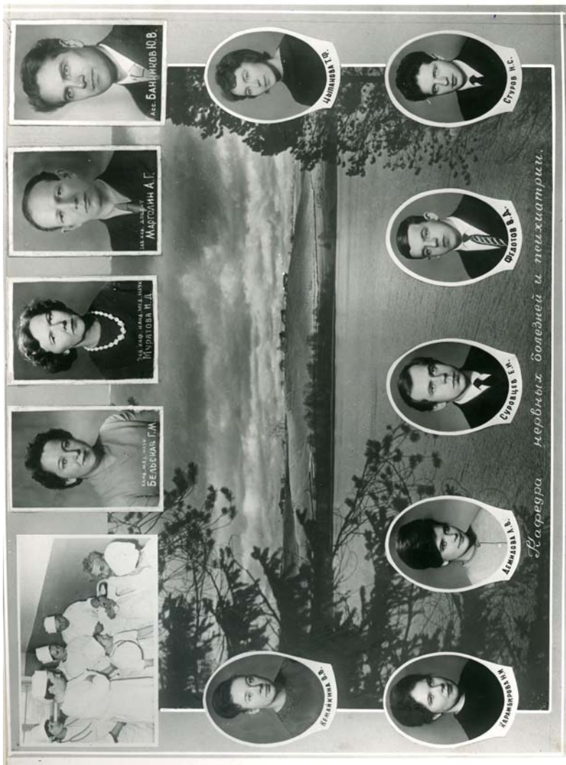
32-й выпуск лечебного факультета АГМИ. 1967 г.