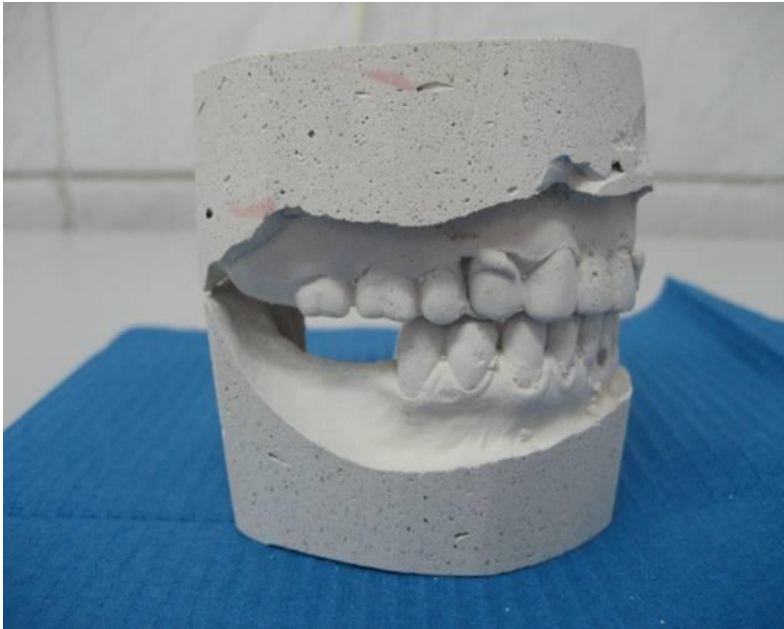
■ Ортопедическая модель